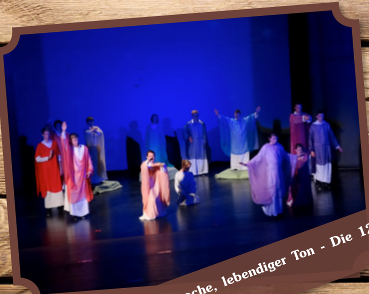
Eurythmie – lebendige Sprache, lebendiger Ton - Die 12.Klassen-Aufführung im Odeion.