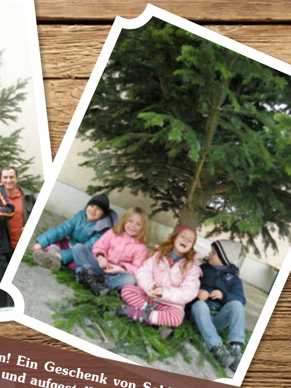
Wir haben einen Weihnachtsbaum! Ein Geschenk von Schloß Hellbrunn/Gassner Gastronomie, überbracht und aufgestellt von der Berufsfeuerwehr Salzburg.