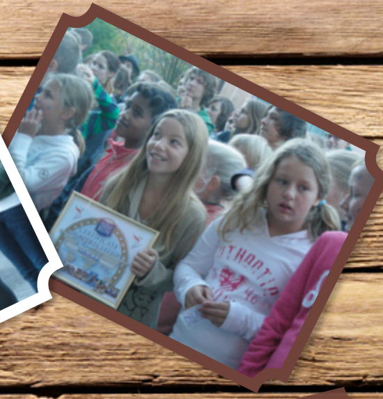
World Harmony Run - Unsere Schule: Station der internationalen Staffel des guten Willens.