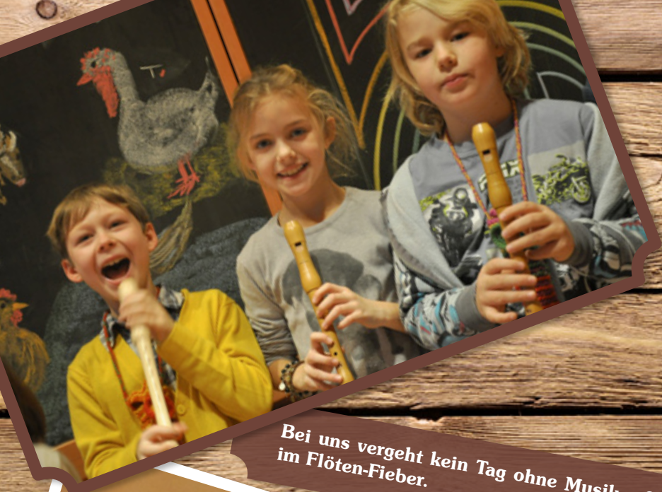
Bei uns vergeht kein Tag ohne Musik – 2.Klasse im Flöten-Fieber.