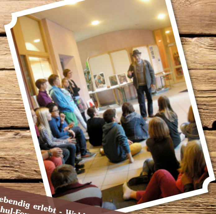
Renaissance lebendig erlebt - Waldorf-Lehrer aus Florenz unterrichtet die 7.Klasse im Schul-Foyer.