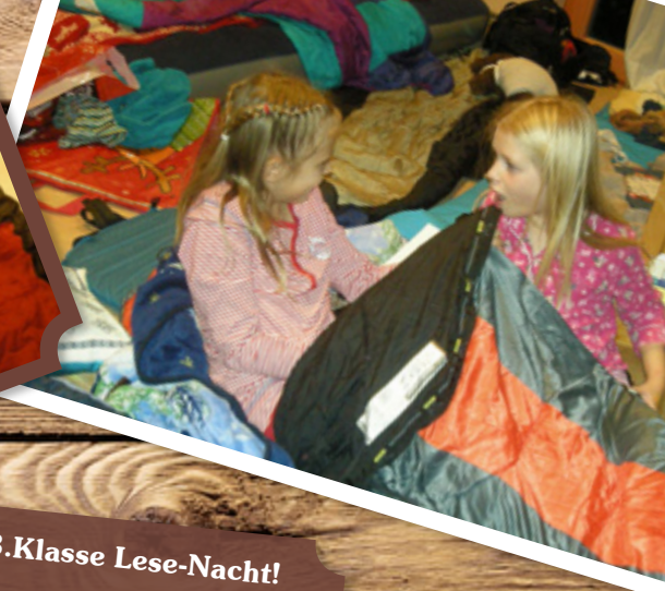
Die Freude am Lesen Lernen - 3.Klasse Lese-Nacht!