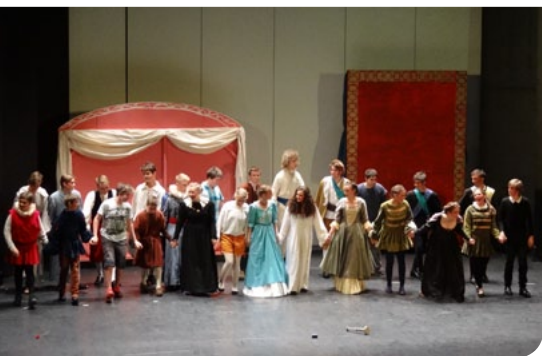
UNSERE 8. KLASSE

– UNSERE „DREI JUNGEN“, DIE IN DIESEM SCHULJAHR MIT ELAN, LEICHTIGKEIT, ERNST, BEWEGLICHKEIT, KREATIVITÄT UND VIEL LIEBE ZU DEN SCHÜLERINNEN ALS KARENZVERTRETER/INNEN IN DEN FÄCHERN WERKEN, TISCHLERN, PLASTIZIEREN, MALE-REI, GRAFIK, DRUCK, GITARRE + SPIELERISCHE BEWEGUNG NEUEN SCHWUNG UND BEGEISTERUNG IN UNSERE KLASSEN GEBRACHT HABEN! WIR DANKEN EUCH! VIEL GLÜCK AUF EUREM WEG UND BITTE KOMMT BALD WIEDER ZURÜCK!