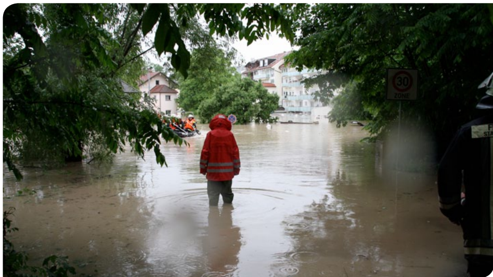
HOCHWASSER JUNI 2013 IN FREILASSING, FREIMANNSTRASSE