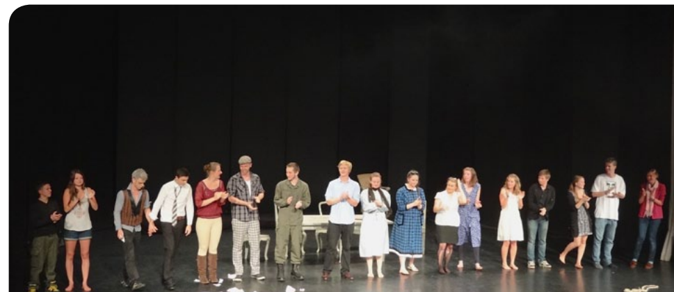
THE CLASS OF 2013 – SCHLUSSAPPLAUS 12. KLASSE-SPIEL

– IHR HABT EINEN LEBENSABSCHNITT IN DER RUDOLF-STEINER-SCHULE SALZBURG ABGESCHLOSSEN. IHR KÖNNT STOLZ AUF EUCH SEIN! WIR WERDEN EUCH SEHR VERMISSEN, BZW. HOFFEN, DASS WIR EINIGE VON EUCH IM NÄCHSTEN JAHR WIEDERSEHEN WERDEN! IN ERINNERUNG BLEIBEN UNS U.A., ABER VOR ALLEM, EURE PROJEKT-PRÄSENTATIONEN, EURE BEEINDRUCKENDEN THEATERAUF- FÜHRUNGEN DIESES SCHULJAHRES, EURE LEISTUNGEN BEI DER SCHRIFTLICHEN UND MÜNDLICHEN MATURA UND EURE PRÄSENZ AUF DEM SCHULGELÄNDE ALS LEBENSFROHE, MITFÜHLENDE, KRITI- SCHE, HILFSBEREITE, ALLES HINTERFRA- GENDE, HOCHINTERESSANTE JUNGE MENSCHEN! VIEL GLÜCK AUF EUREM WEG!