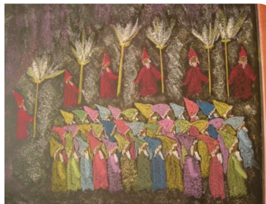
1. KLASSE, A. WIENKE-KRATSCHEMER