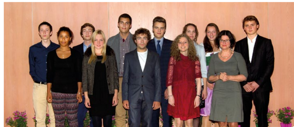
UNSERE MATURANTINNEN 2013