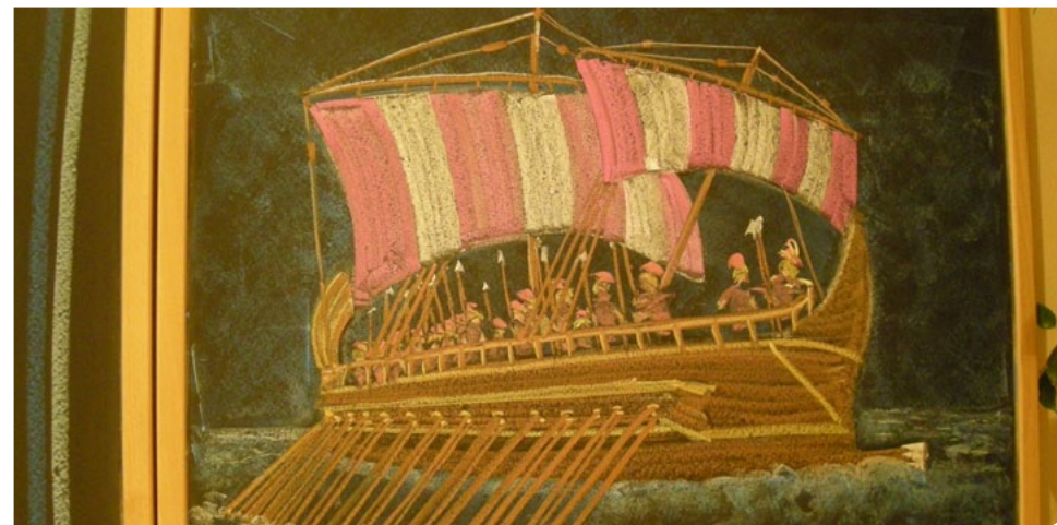
5. KLASSE, D. REISER