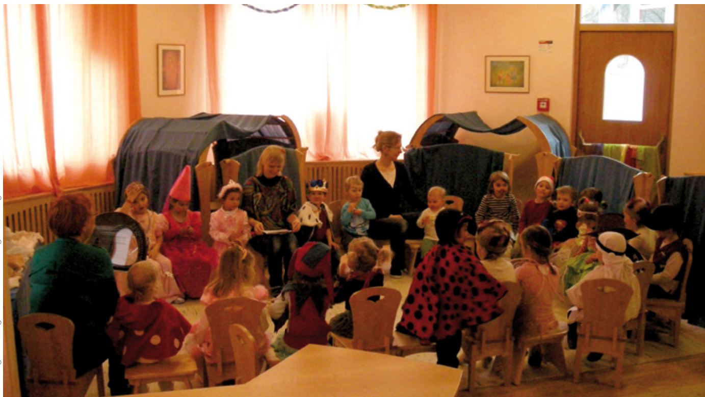
Faschingsdienstag im Waldorf Kindergarten Langwied

Ein großes Dankeschön und Bravo an die Eltern des Waldorfkindergartens Aignerstraße für ihren erfolgreichen Flohmarkt im Februar!